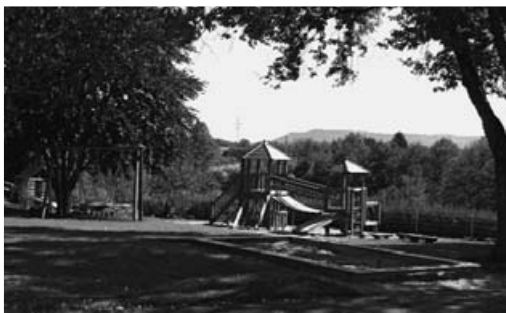
Der idyllische Spielplatz am Kindergarten Auf Mauern

Die Verwaltung plante eine massive Gebührenerhöhung, die für viel Unruhe sorgte. Letztendlich beschloss der Gemeinderat eine Erhöhung auf 2,50 € pro Wochenstunde, was einen Kostendeckungsgrad der Betriebskosten abzüglich kalkulatorischer Kosten von fast 18 Prozent bedeutet. 20 Prozent werden weiterhin angestrebt, aber mit dem neuen Satz liegen wir schon weit über dem Durchschnittssatz in Baden-Württemberg. Der