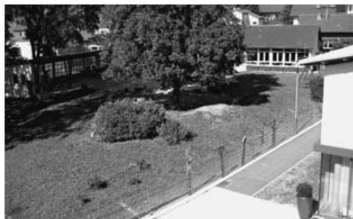
Blick vom Haus »Im Dorf« zum Kindergarten Hanflandweg: Betreutes Wohnen und Kindergarten ergänzen sich

Ein „Heißes Eisen“ ist schon wieder vergessen: Vor Weihnachten 2006 machte die Verwaltung im Amtsblatt einen Vor-