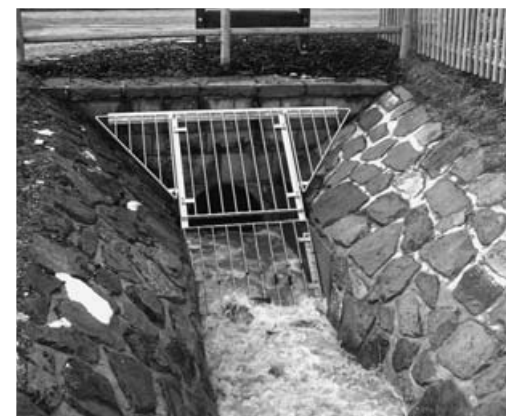
Der Einlauf des Hauwiesenbaches

Es ist eine Binsenweisheit – Hochwasser lässt sich am wirkungsvollsten durch Rückhaltung des Regenwassers am Entstehungsort vermeiden. Immerhin führte